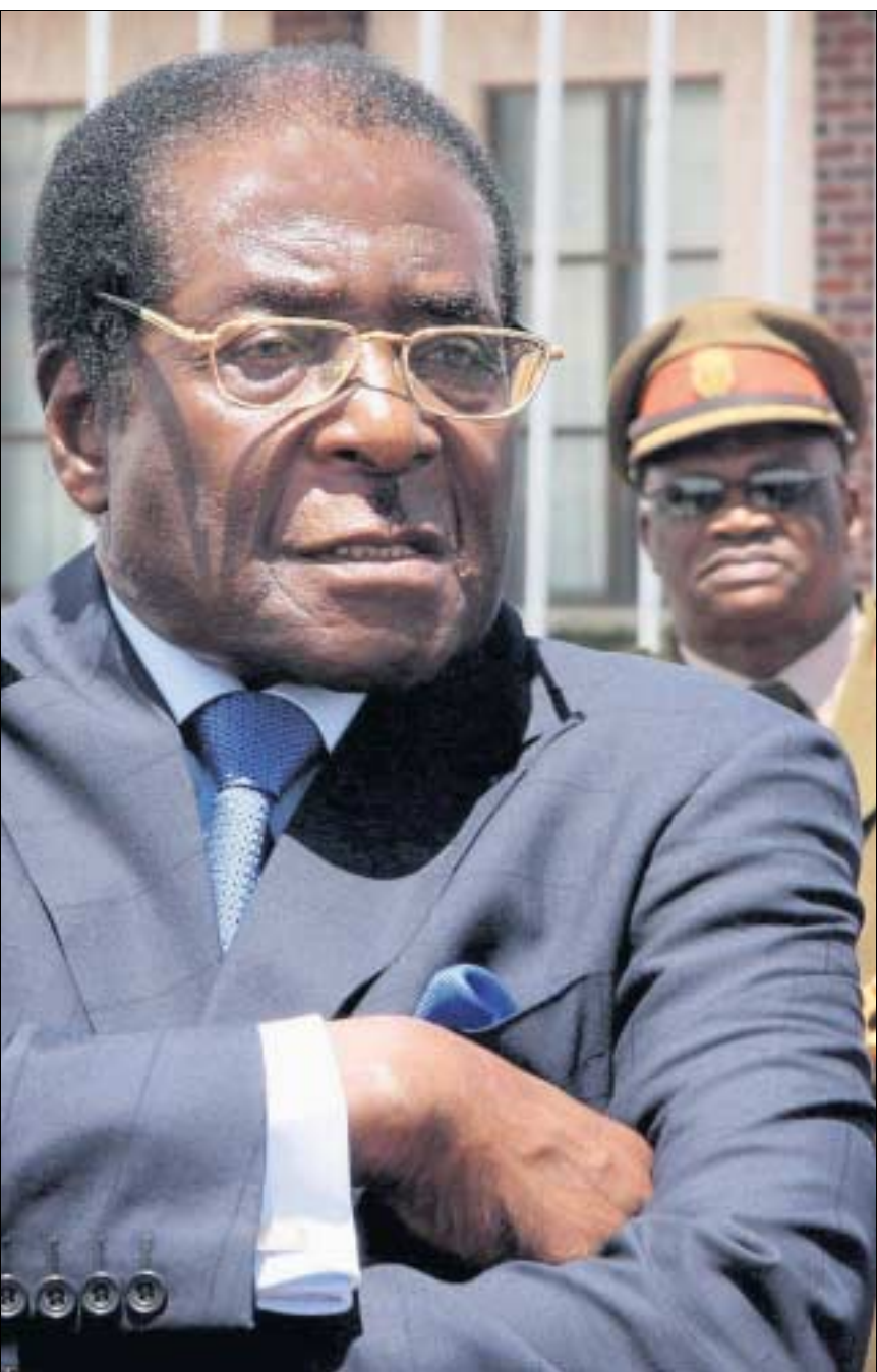
Robert Mugabe in einer Aufnahme von Anfang Jahr.